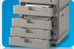
Accès rapide au papier