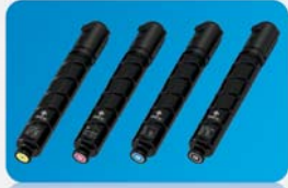
Remplacement facile du toner