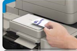
Lecteur de cartes sans contact